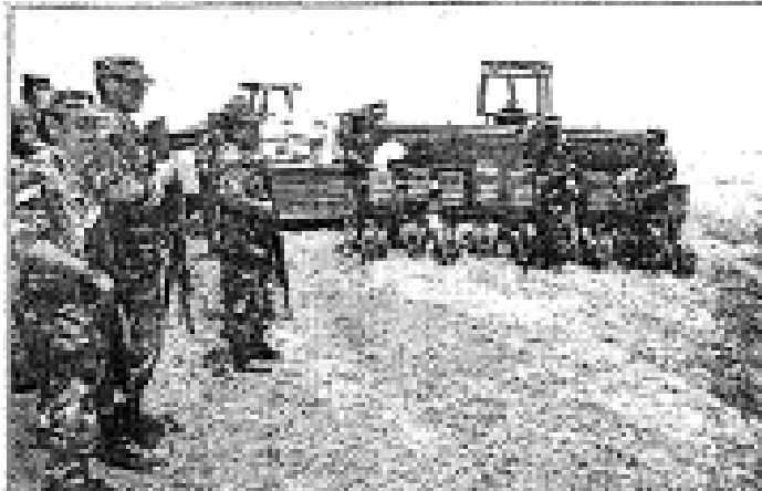
Mientras los sojeros prosiguen los sembrados, los efectivos militares custodian una finca de la zona de Fassardi del Guairá.