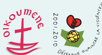
Photos: Cover Illustration: Paul Jeffrey/ACT - Banner Design: www.dendron-edition.ch · Print: www.leidenschaft.ch